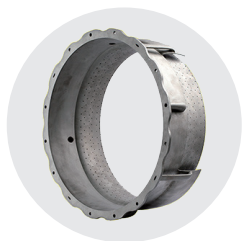
镍基高温合金 航空发动机机匣